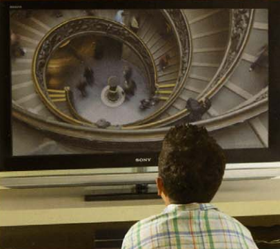
200HZ LCD-TV SONY KDL-40Z4500