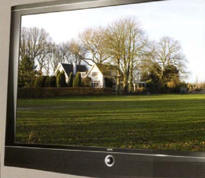
LCD-TV LOEWE ART 42 SL