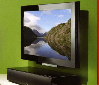
HOME CINEMA CANTON DM90